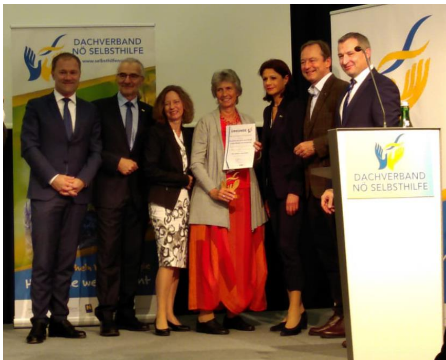
Der feierliche Moment – die Ehrung unserer SHG