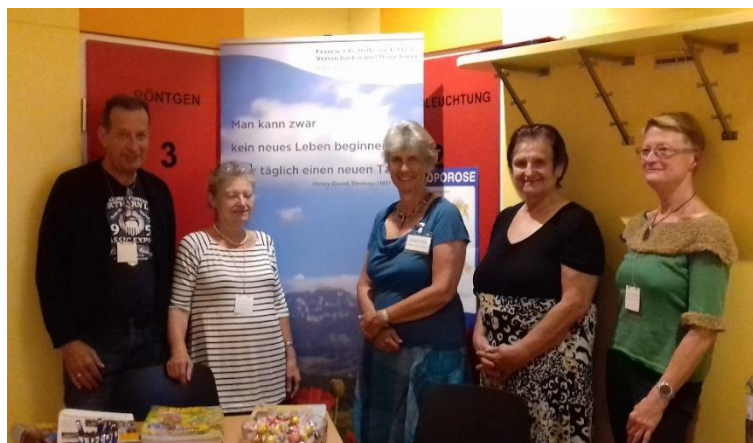
Zu Beginn des Abends - voller Zuversicht und in guter Stimmung ...